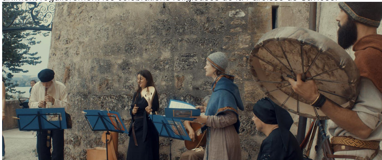
Les Ménestrels de la Tsena au château de Grandson

Les Ménestrels , dans leur formation de base (chant, guitare, flûtes et psaltérion), animent régulièrement les célébrations religieuses de la Paroisse de Savièse.