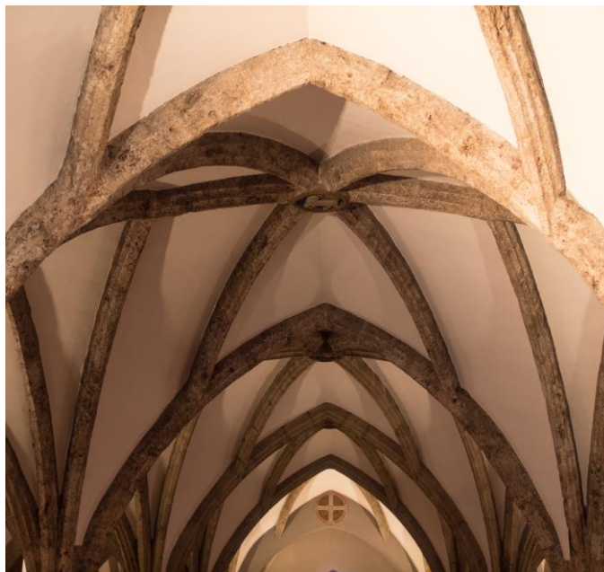
Les nervures en tuf et la voûte gothique tardif de l'église de Savièse (1523)