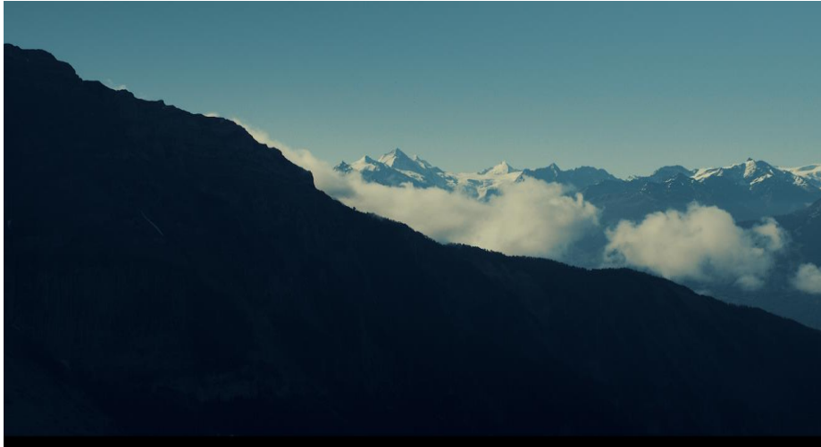
Mysticisme du paysage

La caméra de Jean-Baptiste Héritier s'est en effet promenée dans les richesses locales : paysages dépouillés aux allures tibétaines de la haute vallée des Grandes Gouilles ; pentes escarpées de l'Alperlistock et du Prabé, avec leur faune et leur flore ; ouverture lumineuse sur les grands 4000 des alpes valaisannes.