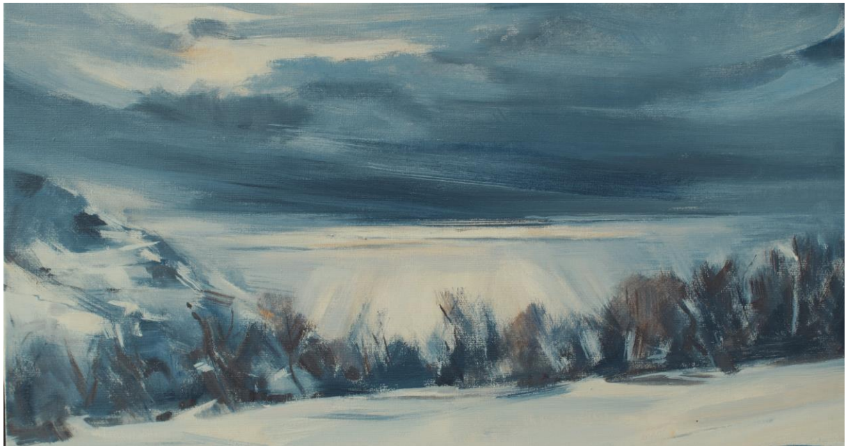
L'École de Savièse Lumière obscure de l'hiver vers Martigny - Isabelle Tabin-Darbellay, atelier