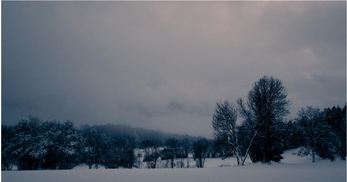
Lumière obscure de l'hiver vers Martigny