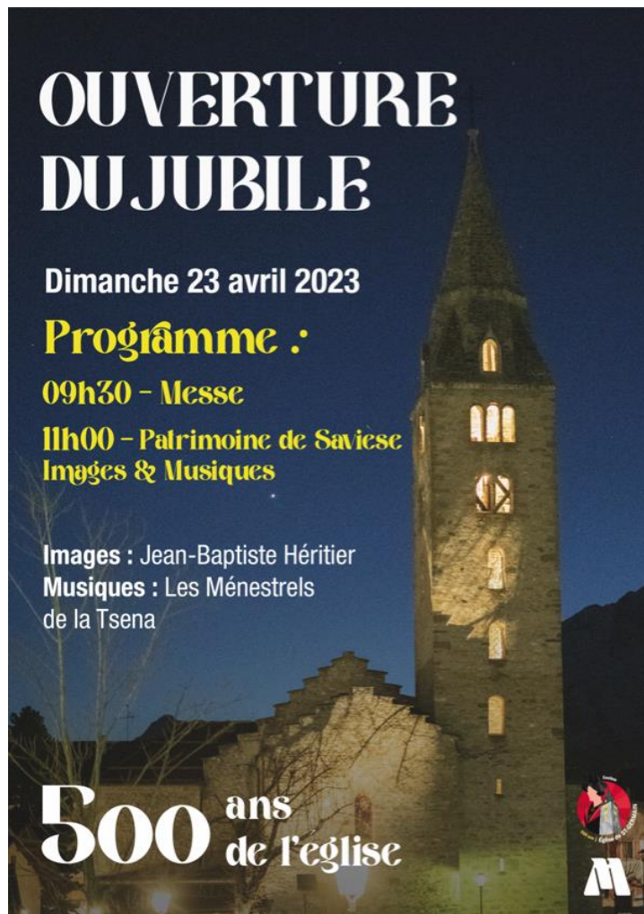
Affiche de la journée d'ouverture du Jubilé